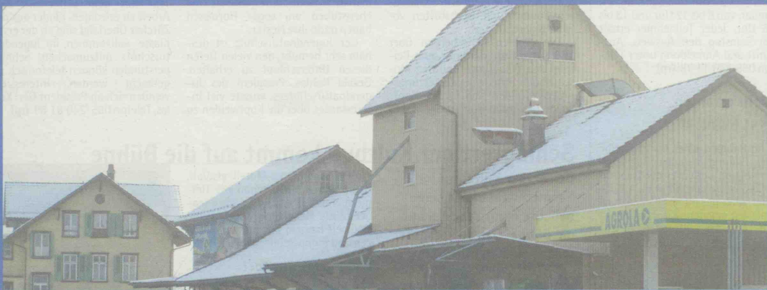
Das Landi-Areal neben dem Bahnhof Bubikon ist ein Standort, für den sich die Braukultur AG interessiert. (kan)

Die Gemeinde Bubikon hat der Braukultur AG erste alternative Standorte für deren Gasthausbrauerei genannt. Immer noch aktuell ist das Landi-Areal beim Bahnhof.